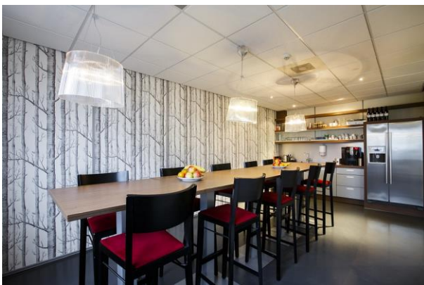
Luxe kantine met uitgebreide keuken